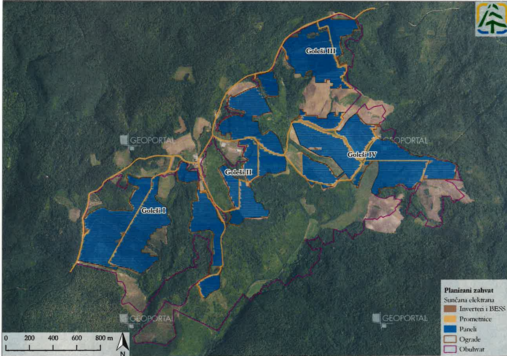
Prilog 2. Elementi zahvata sunčane elektrane