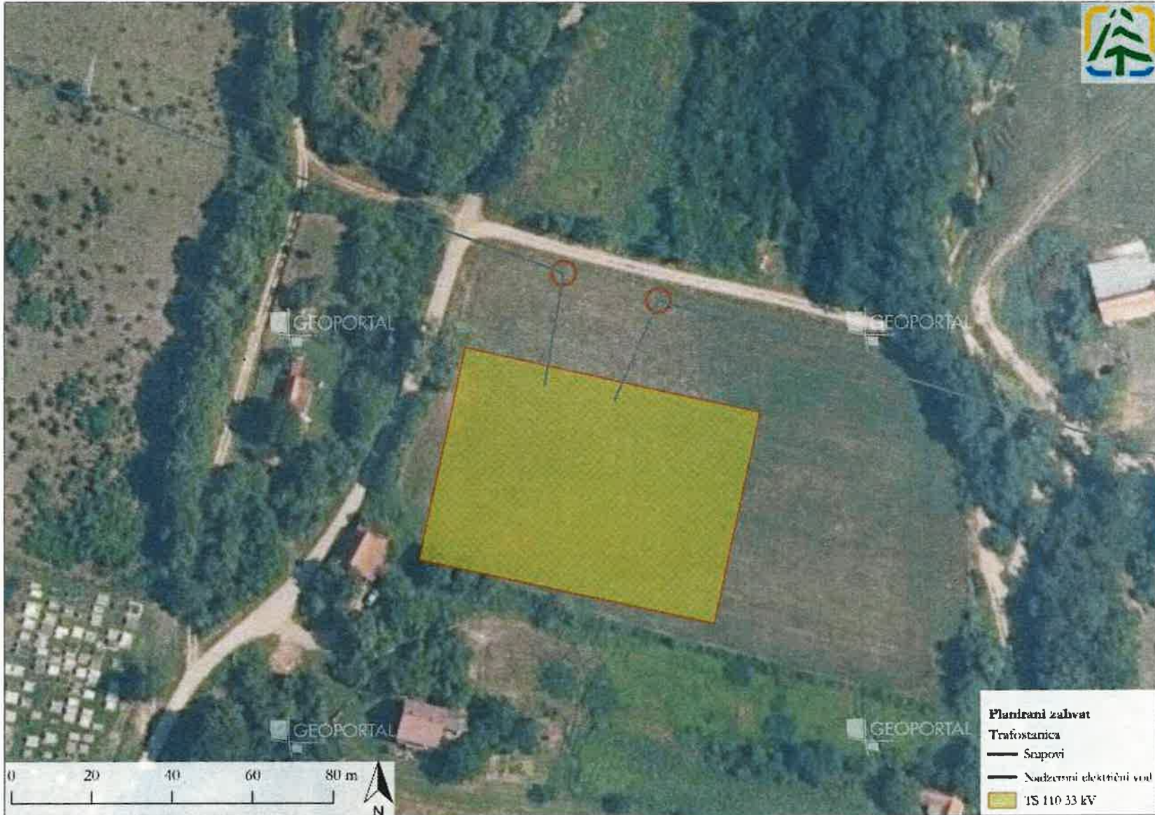
Prilog 3. Elementi trafostanice za potrebe SE Goleši