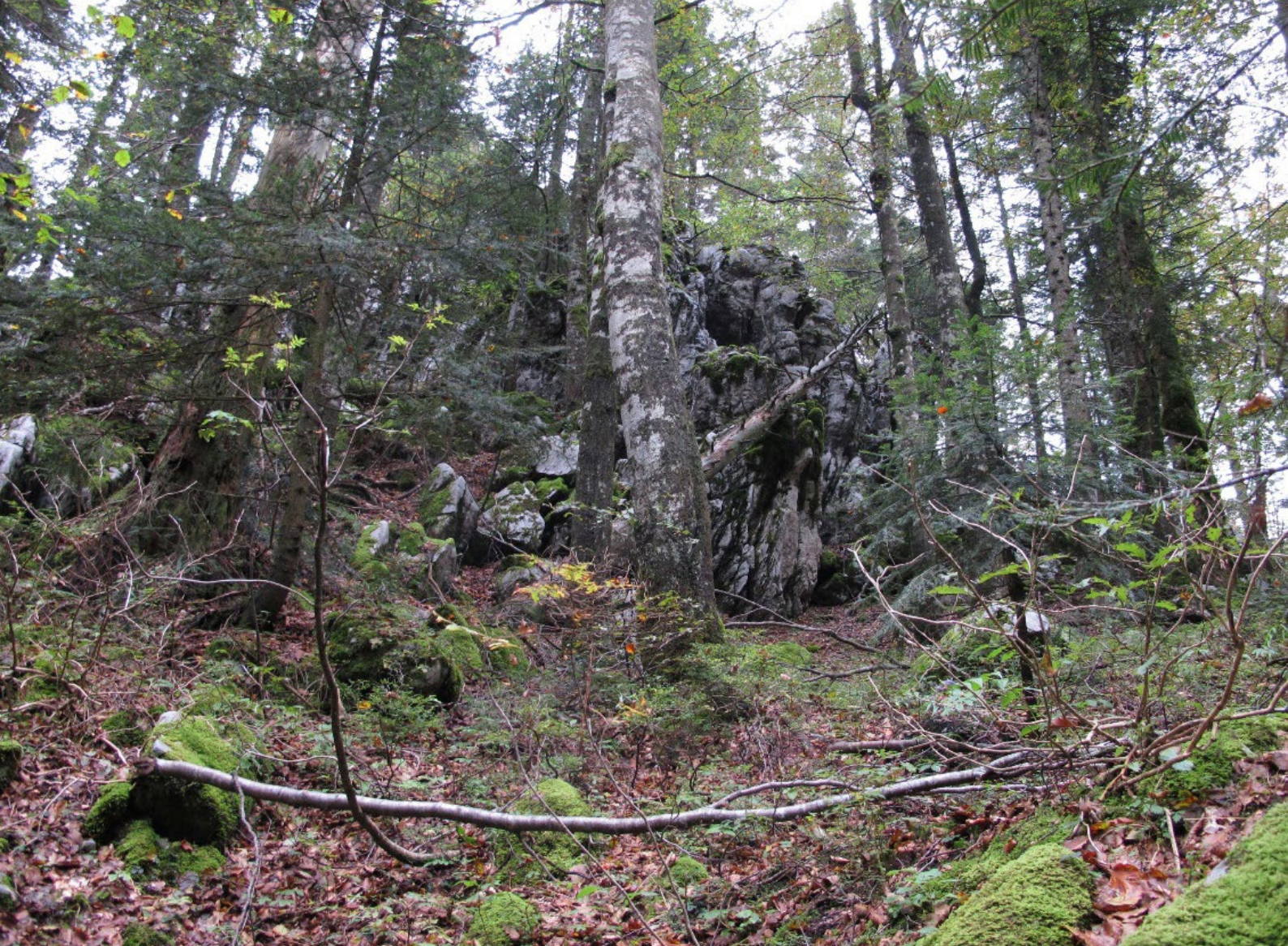
SR Bijele i Samarske stijene, ZZOP