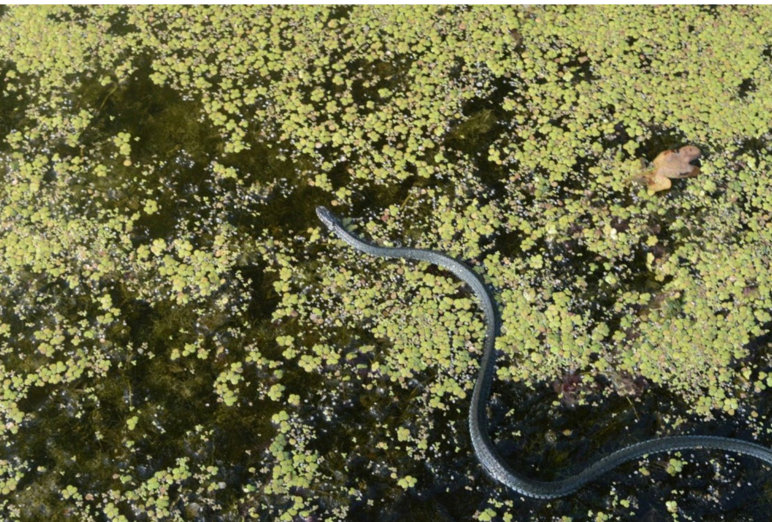
Teren u sklopu aktivnosti Praćenje mjera očuvanja slatkovodnih ekosustava i izrade Priručnika, Natrix natrix, ZZOP